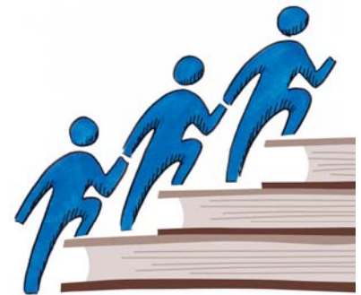
Abb. 3: Logo des LMU Center for Leadership and People Management

Mit unserem Logo hoffen wir, einmal mehr positiv bei Ihnen in Erinnerung zu bleiben und den Wiedererkennungswert unserer Veranstaltungen und Materialien weiter zu erhöhen. Selbstverständlich freuen wir uns über Ihre Eindrücke und Assoziationen zu unserem neuen Logo. Gerne können Sie unter peoplemanagement@psy.lmu.de mit uns in Kontakt treten!